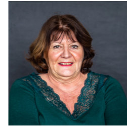
Marinette CAROLE Syndicat Mixte