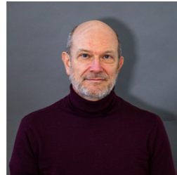
Frédéric BESSET Maire de St-Leu d'Esserent