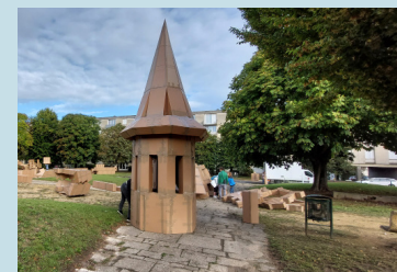
Construction monumentale en cartons dans le cadre du festival Mosaïque de la Faïencerie à Creil