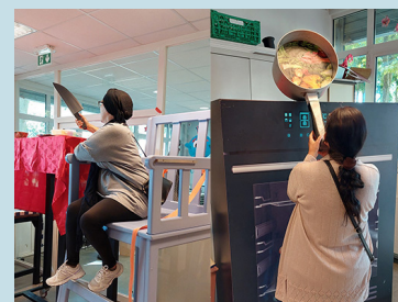
Atelier sur les dangers domestiques à Montataire