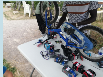
Réparation de vélos avec AU5V