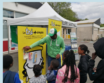
Village écocitoyen à Villers-St-Paul