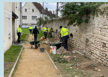
Chantier d'insertion à Précy-sur-Oise