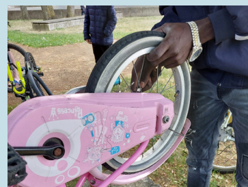
Réparation de vélos avec AU5V