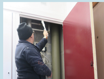
Chantiers d'insertion avec JADE et REB