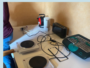
Atelier sur les dangers domestiques avec Tandem Immobilier