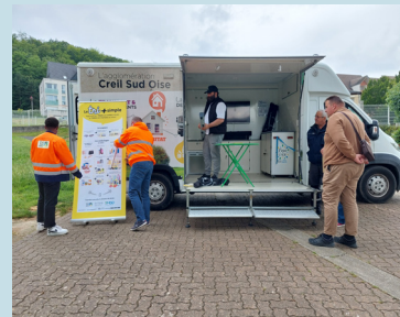
Sensibilisation au tri sélectif avec les ambassadeurs du tri de l'Agglomération Creil Sud Oise