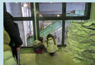
Visite du centre de tri avec le Syndicat Mixte des Vallées de l'Oise de Villers-St-Paul