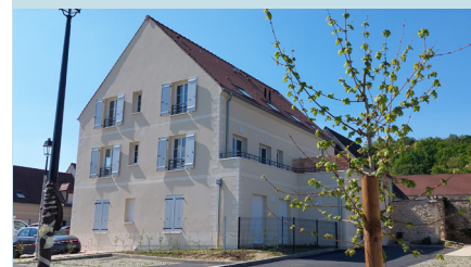
4 logements et 1 boulangerie en RDC à Baillevall

24 nouveaux locataires se sont installés depuis fin avril à Baillevall et Breuil-le-Sec. Par ces réalisations parfaitement intégrées à l'environnement, Oise Habitat tente de répondre à tous les besoins, que ce soit en matière de typologie (du T2 au T4) ou de loyer (du logement très social au logement pour professions intermédiaires).