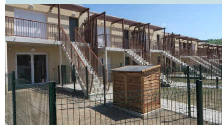
20 logements à Breuil-le-Sec