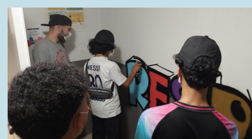
Réalisation d'une fresque collective sur le thème du respect des locaux communs