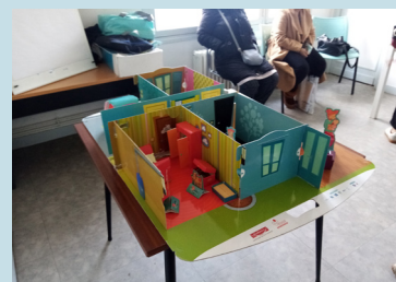
Atelier autour de la Qualité de l'air avec l'association pour la Prévention de la Pollution Atmosphérique