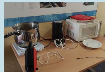
Atelier sur les dangers domestiques avec Tandem Immobilier