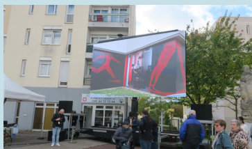
Participation aux festivités autour de la transformation des quartiers de Creil