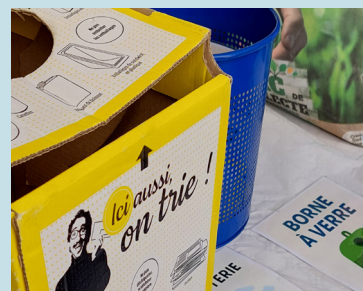
Sensibilisation au tri sélectif et au recyclage dans le cadre des villages du tri